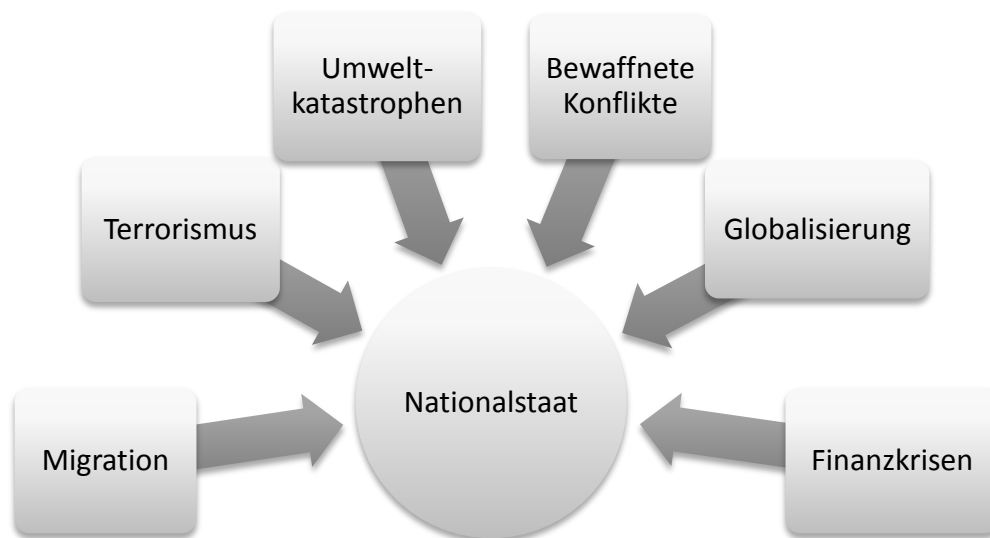
Abbildung 2: Einflüsse auf den Nationalstaat.

Der Nationalstaat ist ein Staatenmodell bestehend aus einem Staat und einer Nation. 23 Der Nationalstaat integriert eine Bevölkerung mit gleicher Kultur, Wertvorstellungen und Brauchtum. Neben extremen Ausprägungen des Nationalstaates im historischen Kontext und dem prognostizierten Ende ist er neben dem Vielvölkerstaat das vorherrschende Staatenmodell. 24